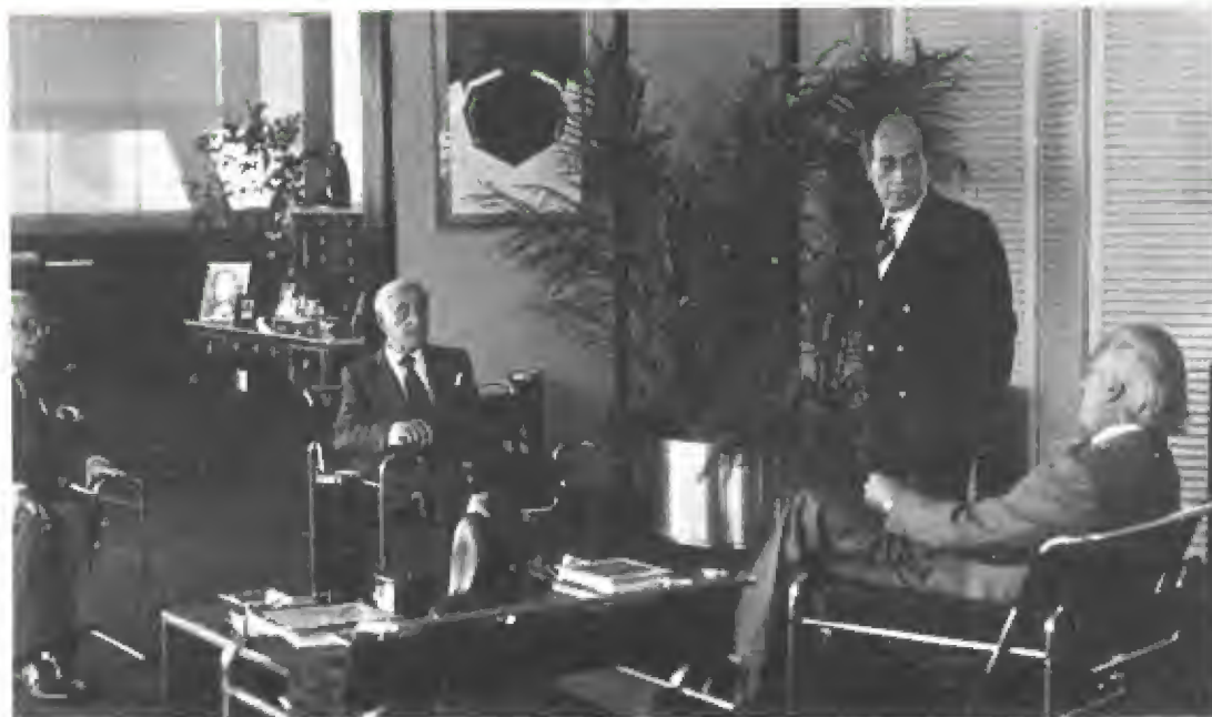
Joaquín Calvo Sotelo – Luis Escobar – José Luis López Vázquez – José Luis de Vilallonga